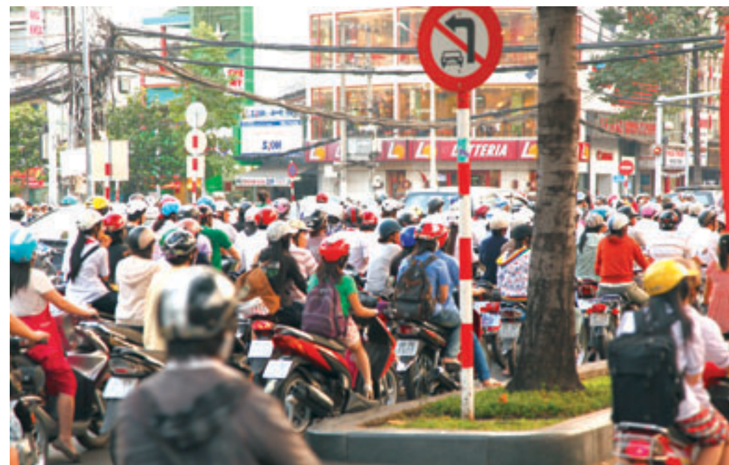
«Пробки» во Вьетнаме создают «мотобайки».