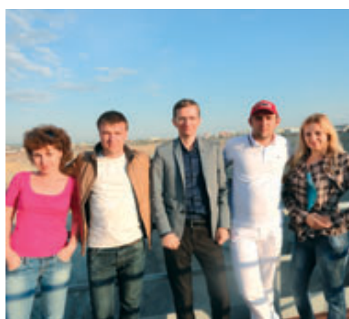
Члены центральной постоянно действующей комиссии Общества «Газпром бурение» во время проверки на Чаяндинском НГКМ.

В целом работа Якутской экспедиции глубокого бурения в области охраны труда, производственного контроля и экологии была признана удовлетворительной. Особое внимание при проведении комплексной проверки уделялось