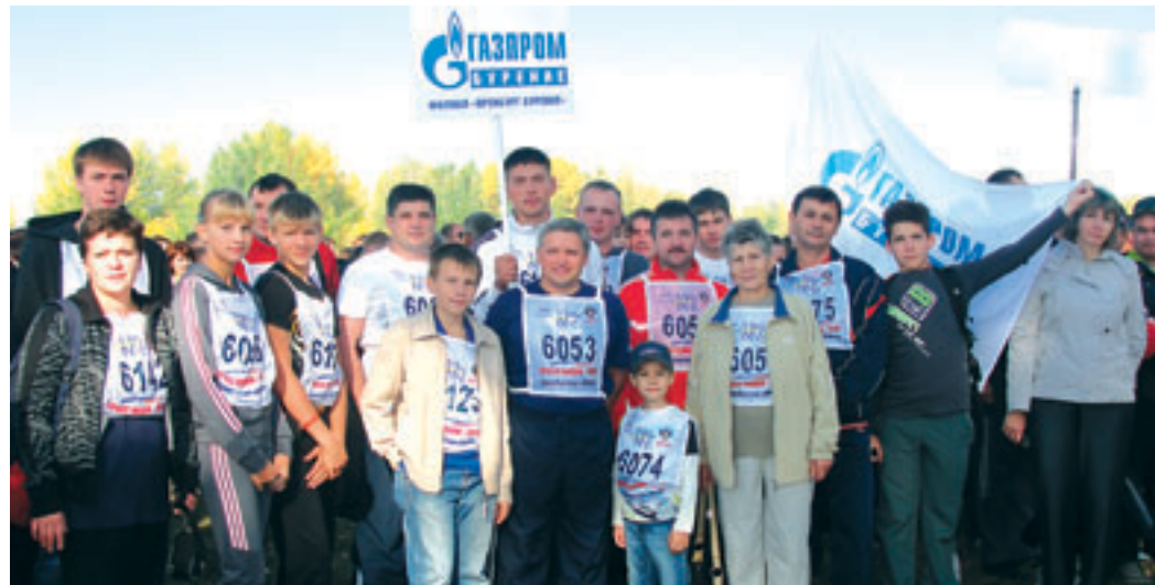
Сборная филиала «Оренбург бурение» на «Кроссе нации-2012».