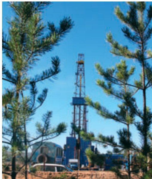
Буровая на скважине № 1 Чунской.

Наличие углеводородов было подтверждено на большинстве скважин, которые строила Красноярская ЭГБ, – отмечает В. Н. Дикопавленко. – Продуктивными оказались скважины № 2, 3 Абаканские, № 2 Ильбокичская, № 3