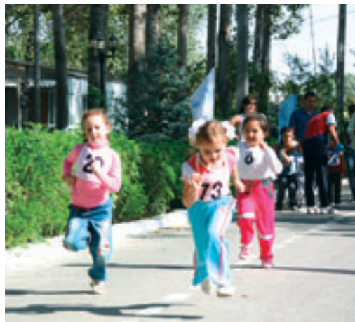
На старте юные участники Спартакиады.

В филиале «Астрахань бурение» завершилась очередная, уже седьмая по счету, летняя Спартакиада. В этом году мероприятие было посвящено 15-летию Общества «Газпром бурение». В погожий сентябрьский денек на базе отдыха «Корсака» собралось более двухсот работников предприятия, поддержать которых в спортивных баталиях приехали и их близкие. Соревнования проводились по олимпийской системе в