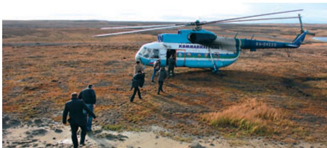
Первый визит на месторождения им. Р. Требса и А. Титова специалистов филиала «Ухта бурение».

В 2013 году филиалу «Ухта бурение» предстоит выйти на новые нефтяные месторождения имени Р. Требса и А. Титова для бурения эксплуатационных скважин. Месторождения находятся за Полярным кругом на территории Ненецкого автономного округа. Объем работ для филиала составляет 17 скважин на двух кустах месторождения им. А. Титова и трех кустах месторождения им. Р. Требса. В районе отсутствует дорожная сеть. Передвижение автотранспорта возможно в зимний период по «зимнику» (с января по апрель), в остальное время – только воздушным транспортом.