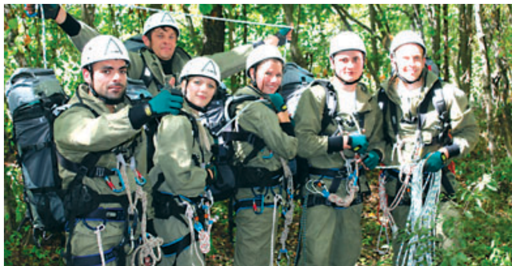
Участники турслета на этапе спортивного ориентирования (фото М. Бакулиной).

Следующий день был особо насыщен события-