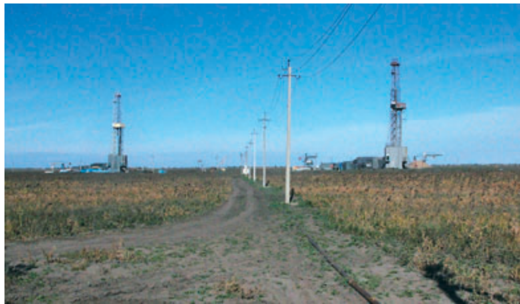
Степновское ПХГ, как и 40 лет назад, основной объект Приволжского УБР.

Если сравнить с пятью скважинами, предоставленными буровикам на Степновском хранилище газа в прошлом году, то высвечивается еще одна проблема предприятия – снижение объемов работ. Помимо Степновки, заметное сокращение количества скважин произошло также на Невском ПХГ. В начале года там планировалось пробурить всего четыре скважины. Но эти планы подверглись корректировке. Заказчик изменил расположение двух из четырех точек на Невском подземном хранилище газа, что автоматически перенесло эти две скважины на будущий год, поскольку специалистам ООО «Газпром инвест Запад» предстоит затратить несколько месяцев на переоформление проектной документации.