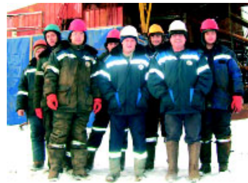
27.04.2011 начата бурением скв. № 321-45.