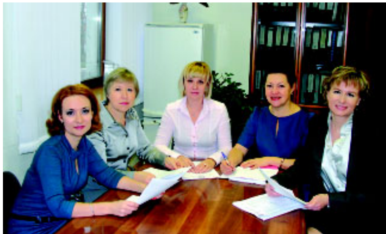
Сотрудницы учетно-контрольной группы филиала «Оренбург бурение» работают в единой команде.