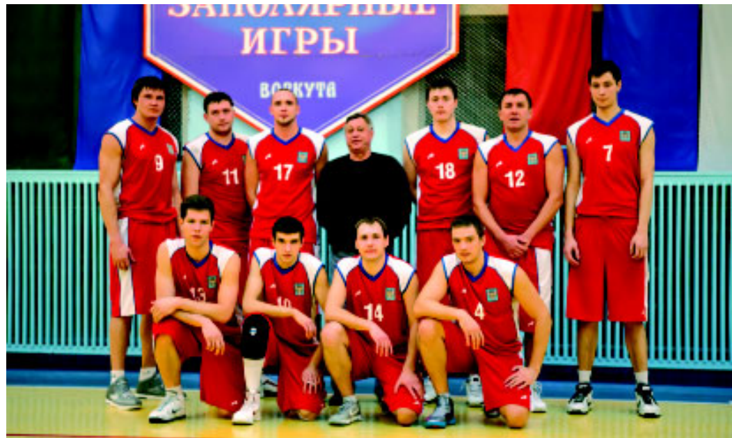
Баскетбольная команда ООО «Газпром бурение» сильнейшая в Новом Уренгое.

Сборная команда по баскетболу ООО «Газпром бурение», она же на протяжении 14 лет – сборная города Новый Уренгой – снова чемпион. Третий раз подряд наши спортсмены одержали победу на Спартакиаде народов Севера России «Заполярье игры», которая проходила в г. Воркуте с 28 октября по 6 ноября 2012 года. В этом году в XIV Спартакиаде народов Севера принимали участие 36 северных городов страны: от Якутии до Кольского полуострова. Состязания проходили по 11 видам спорта. В их числе лыжные гонки, баскетбол, волейбол, футбол, художественная гимнастика, плавание, бокс, дзюдо, греко-римская борьба и другие. Из 6 баскетбольных команд, оспаривавших звание сильнейших, наша выступила на порядок лучше других.