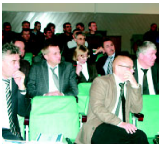
Идет совет буровых мастеров.

В конце первой декады ноября состоялся очередной Совет буровых мастеров филиала «Уренгой бурение».