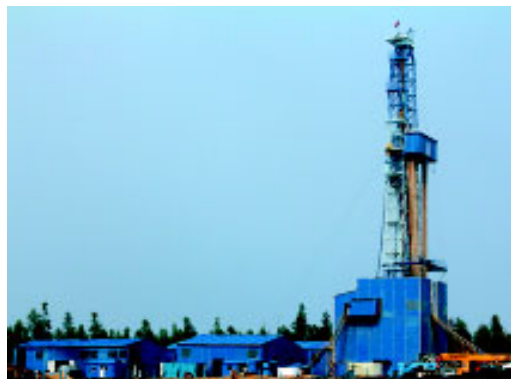
Первая субгоризонтальная скв. № 321-61Г.

Первого декабря 2012 года свой третий день рождения отметил коллектив Якутской экспедиции глубокого бурения филиала «Астрахань бурение». Это структурное подразделение было образовано в соответствии с приказом ООО «Газпром бурение» для организации и производства работ на Чайандинском месторождении, расположенном в Ленском районе Республики Саха (Якутия).