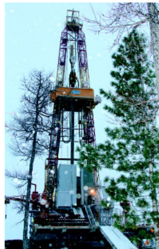
БУ-5000/320ЭУК-Я на скважине № 181 Западно-Ярояхинского лицензионного участка. С декабря 2012 года здесь для ООО «Севернефть-Уренгой» скважины будут строиться по индивидуальным проектам.