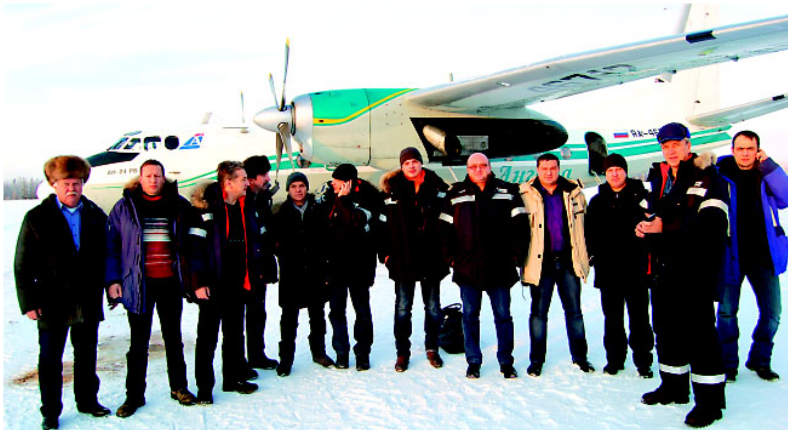
Участники облета строящихся скважин на Чаюнде.