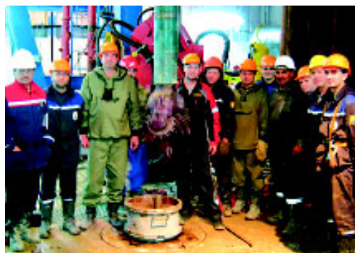
Забурка первой скважины на Чайанде.